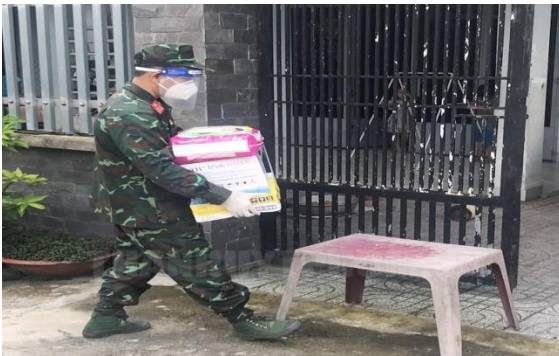
Mang nhu yếu phẩm tới tận nhà dân.