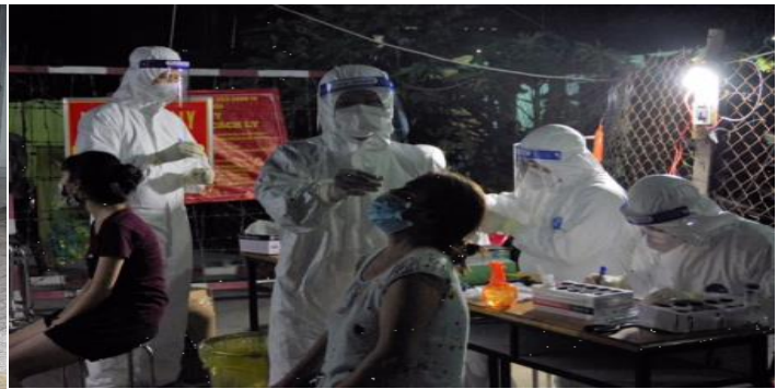
Lực lượng Quân y tham gia xét nghiệm, truy vết F0 trong cộng đồng